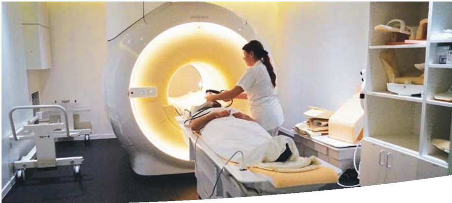
Das neue MRT in Hagenow bietet mehr Platz für Patienten

D as Facharztzentrum Westmecklenburg bietet mit seiner radiologischen Praxis am Krankenhaus in Hagenow modernste Technik für bildgebende Verfahren. Für ambulante Patienten stehen Geräte der neuesten Generation zur Verfügung. Dazu zählt auch ein neues MRT mit einer größeren Röhre als bei üblichen Tomographen. Die 70 cm große Öffnung verhindert ein Engegefühl während der Untersuchung. Die besonders kompakte Bauweise ermöglicht außerdem, dass der Kopf des Patienten bei vielen Untersuchungen außerhalb der Röhre verbleiben kann. Damit können auch bei Patienten mit Platzangst die meisten Untersuchungen problemlos durchgeführt werden.